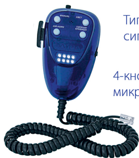
Типы звуковых сигналов